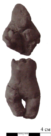
Рис. 5. Глиняная статуэтка из Ц-10/Серг-1898 до утраты «ног» (из: [Спицын, 1905, с. 66, рис. 131])

И. В. Зернов. Глиняная статуэтка из раскопок С. И. Сергеева в Гнёздове