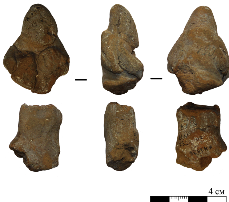
Рис. 3. Фрагменты глиняной статуэтки из погребения Ц-10/Серг-1898

И. В. Зернов. Глиняная статуэтка из раскопок С. И. Сергеева в Гнёздове