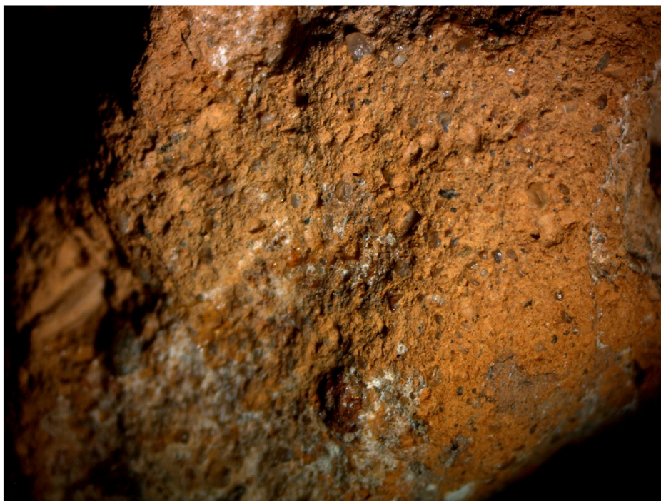
Рис. 4. Глиняное тесто статуэтки на участке разлома Fig. 4. Clay statuette at the site of the fault

Два обнаруженных в кострище изделия из глины являются, по всей видимости, верхней и нижней частями одной глиняной антропоморфной фигуры 13 (рис. 3). Процедура интерпретации данных изделий была проведена с применением методов визуального и трасологического анализа. Оба фрагмента состоят из красной плохо обожженной глины с включением песка (рис. 4) 14 . Стоит отметить, что отсутствие дресвы в глиняном тесте статуэтки отличает его от теста, характерного для глиняных сосудов Гнёздова. Один фрагмент статуэтки в настоящий момент имеет длину 3,6 см. Уже после обнаружения эта часть статуэтки претерпела значительные утраты: так, в настоящий момент утрачены обе детали, которые можно с определенной уверенностью определить как ноги фигуры 15 . О существовании ног свидетельствует фотография, сделанная вскоре после раскопок 16 . Эта же фотография, по всей видимости, была использована в работах В. И. Сизова и А. А. Спицына (рис. 5). Другой фрагмент, имеющий высоту 4,7 см, отличается лучшей сохранностью: с определенной осторожностью в интерпретации на нем можно определить голову, спину и согнутые в локтях руки – ими фигурка прижимает к себе какие-то сложноопределимые предметы 17 . Стоит отметить, что у обоих фрагментов статуэтки участки разломов тоже обожжены.