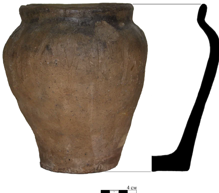
Рис. 2. Сосуд из погребения Ц-10/Серг-1898

Рассматриваемый курган находился в южной части Центральной курганной группы (рис. 1) 4 . Участок расположения курганов Центральной группы, исследованных С. И. Сергеевым в 1898–1899 годах, удается довольно точно локализовать благодаря составленному исследователем рукописному графическому плану Гнёздовского археологического комплекса [Медведева, 2018, с. 279, рис. 9]. Местоположение непосредственно кургана Ц-10/Серг-1898 в пределах этого участка удается определить на инструментальном плане, имеющемся среди материалов раскопок [там же, с. 277, рис. 7]. Высота курганной насыпи составила около 1,6 м при диаметре около 7,7 м 5 . В самой курганной насыпи был найден горшок с небольшим количеством костей 6 . Под насыпью было зафиксировано погребальное кострище округлой формы с диаметром около 1,07 м, из которого происходил немногочисленный инвентарь, представленный двумя фрагментами глиняной статуэтки, тремя небольшими слитками 7 и двумя железными стерженьками. К настоящему времени в фондах Отдела археологических памятников Государственного исторического музея хранятся лишь фрагменты глиняной статуэтки 8 , местонахождение остальных предметов неизвестно.