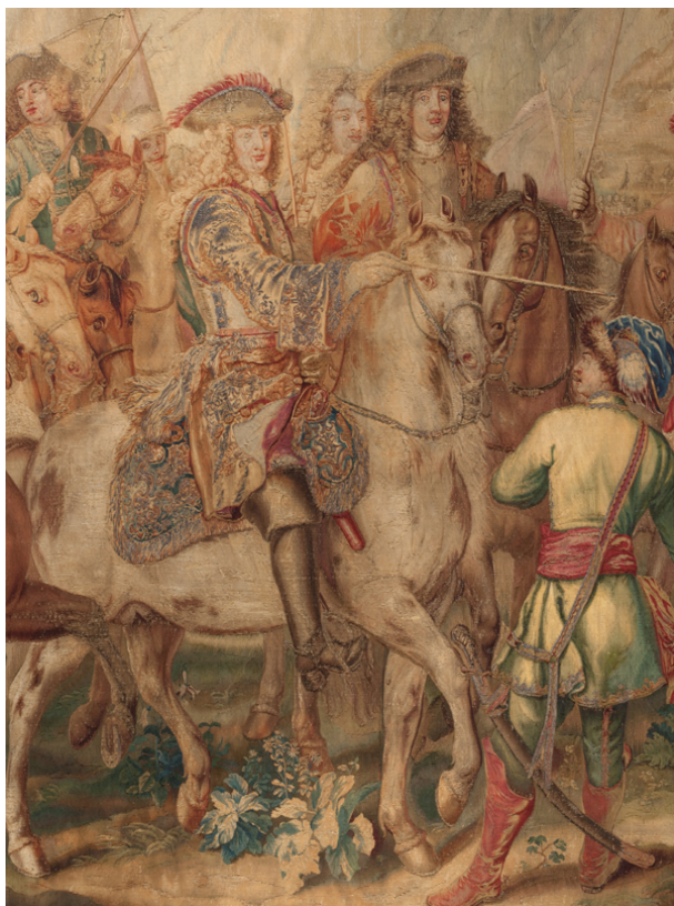
Рис. 5. Шпалера «Завоевание Офена герцогом Карлом Лотарингским». Фрагмент

И. В. Бородин. Шпалера «Завоевание Офена герцогом Карлом Лотарингским» из Королевского дворца Будапештской крепости: к истории создания, бытования и реставрации