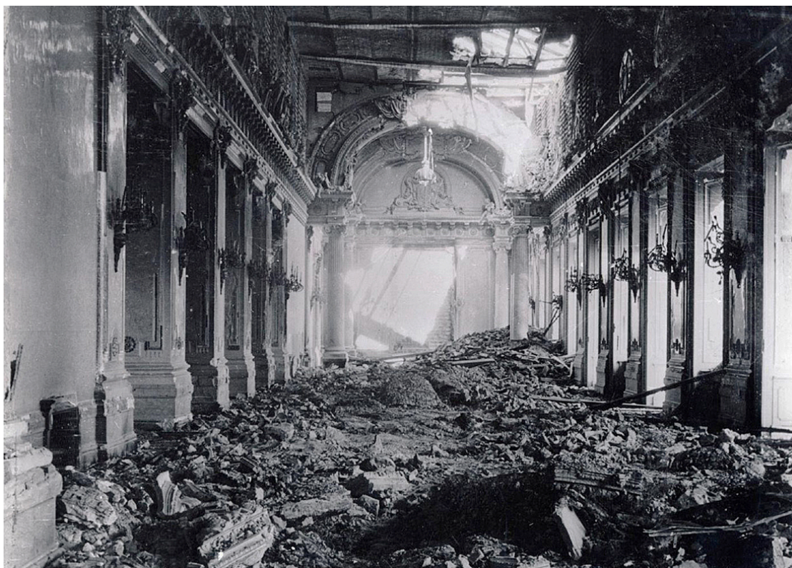
Рис. 11. Королевский замок Будапештской крепости. 1945 г.

И. В. Бородин. Шпалера «Завоевание Офена герцогом Карлом Лотарингским» из Королевского дворца Будапештской крепости: к истории создания, бытования и реставрации