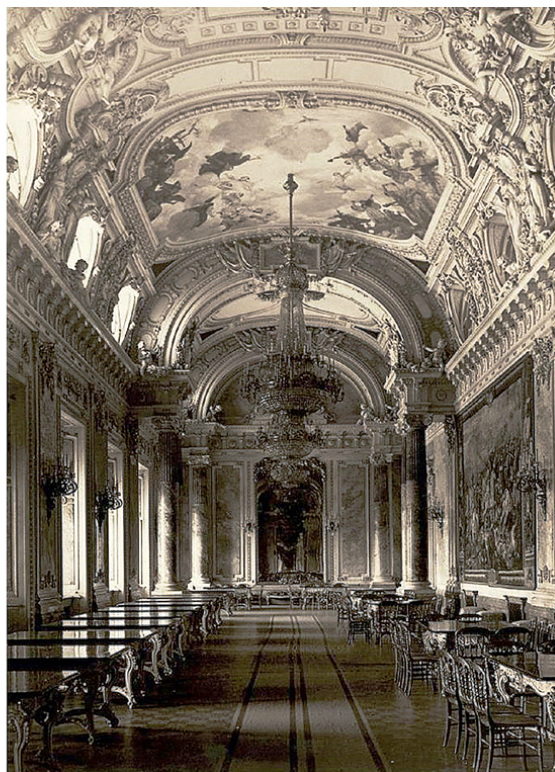
Рис. 10. Королевский замок Будапештской крепости. 1930–1940-е гг.