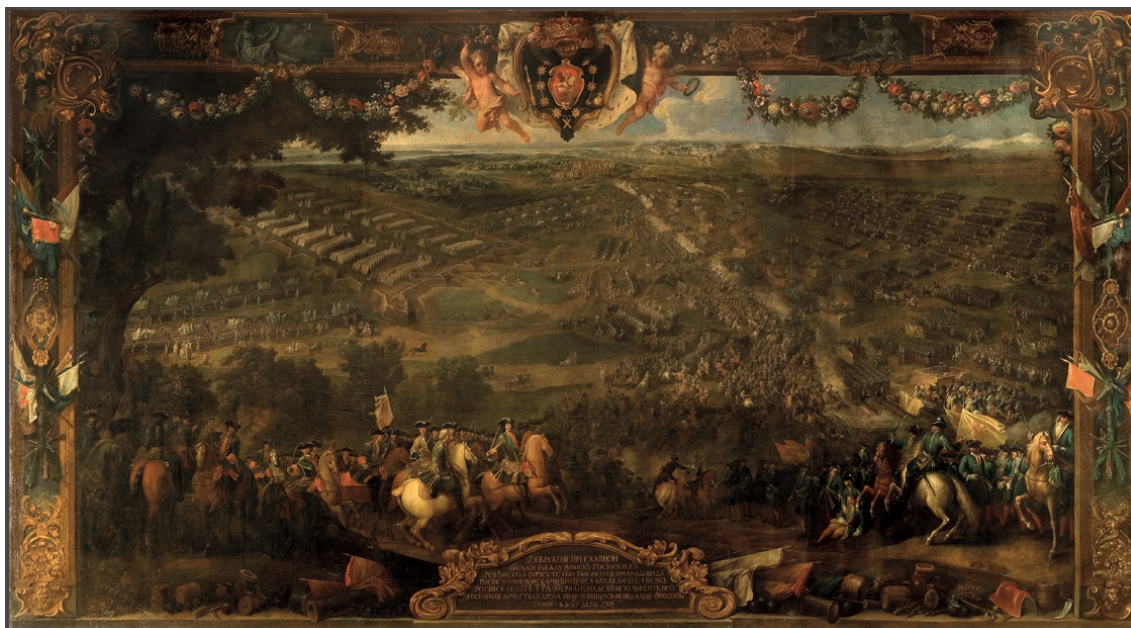
Рис. 3. Мартен Пьер-Дени. «Полтавская баталия». Картон для шпалеры. 350 × 637 см. Государственная Третьяковская галерея. Инв. 25564

И. В. Бородин. Шпалера «Завоевание Офена герцогом Карлом Лотарингским» из Королевского дворца Будапештской крепости: к истории создания, бытования и реставрации