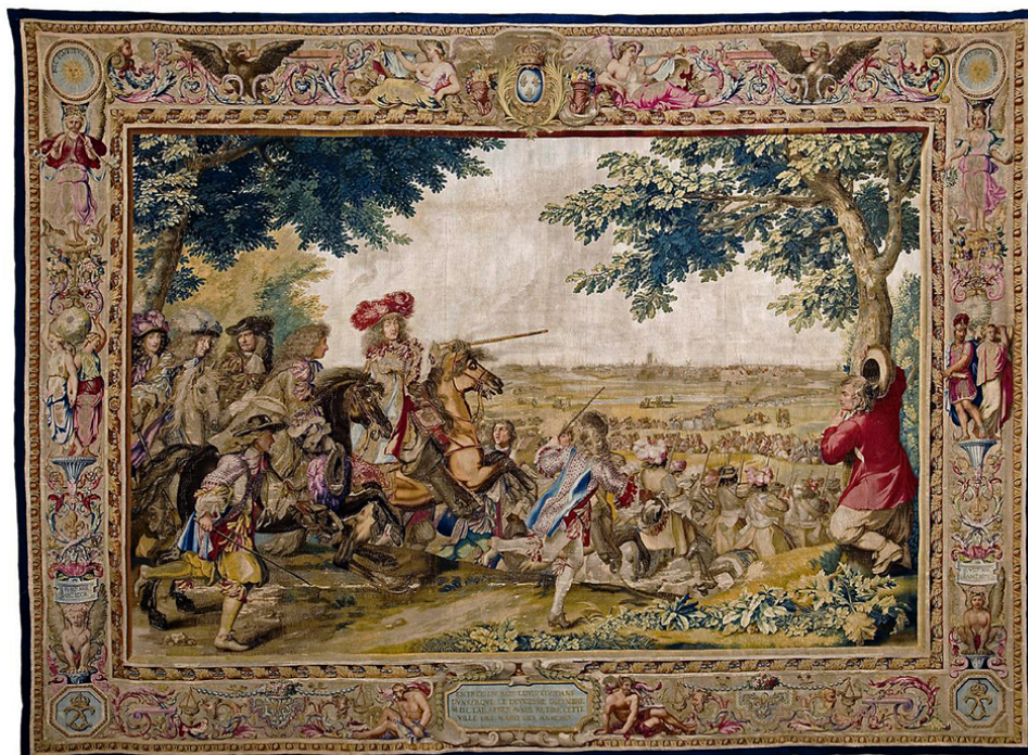
Рис. 2. Шпалера «Въезд короля в Дюнкерк 2 декабря 1662 г.» Из серии «История Короля». По эскизам Ш. Лебрена и А. Д. ван дер Мейлена. Мануфактура Гобеленов. Париж 1668–1671 гг. Париж. Mobilier National. 500 × 690 см. Инв. F 2175 C/1