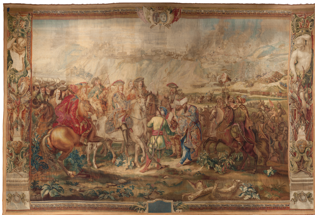
Рис. 4. Шпалера «Завоевание Офена герцогом Карлом Лотарингским». Из серии «Победы герцога Карла Лотарингского» (1709–1725). Шерсть, шелк, золотые нити. Шпалерное ткачество. 443 × 655 см. Общий вид. Фото: Андрей Кудрявицкий. 2011

И. В. Бородин. Шпалера «Завоевание Офена герцогом Карлом Лотарингским» из Королевского дворца Будапештской крепости: к истории создания, бытования и реставрации