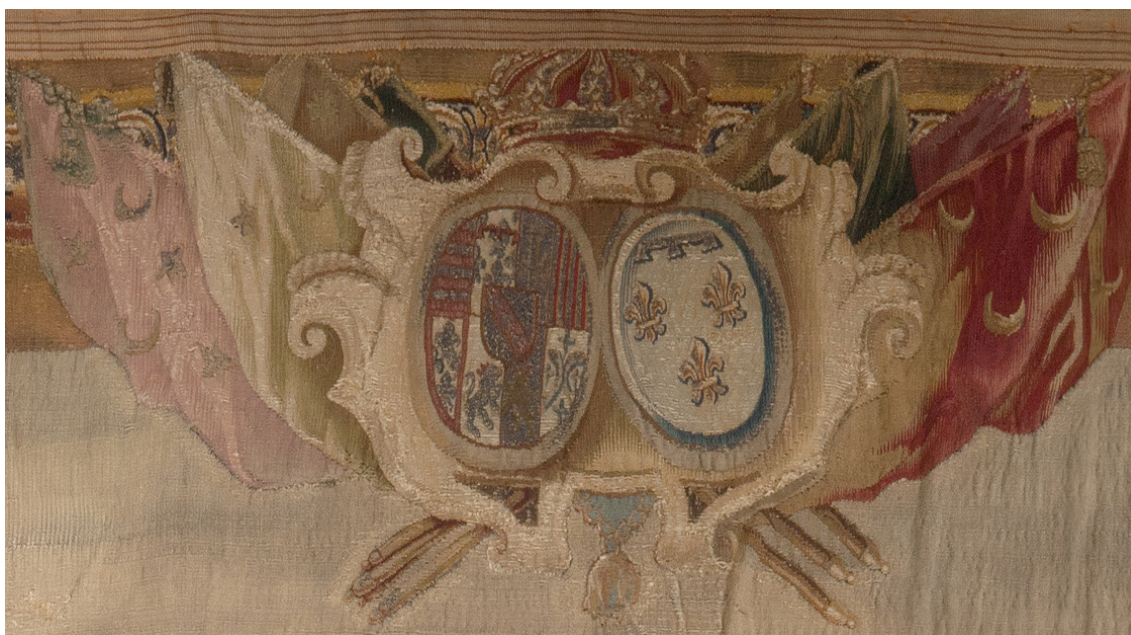
Рис. 8. Шпалера «Завоевание Офена герцогом Карлом Лотарингским». Фрагмент