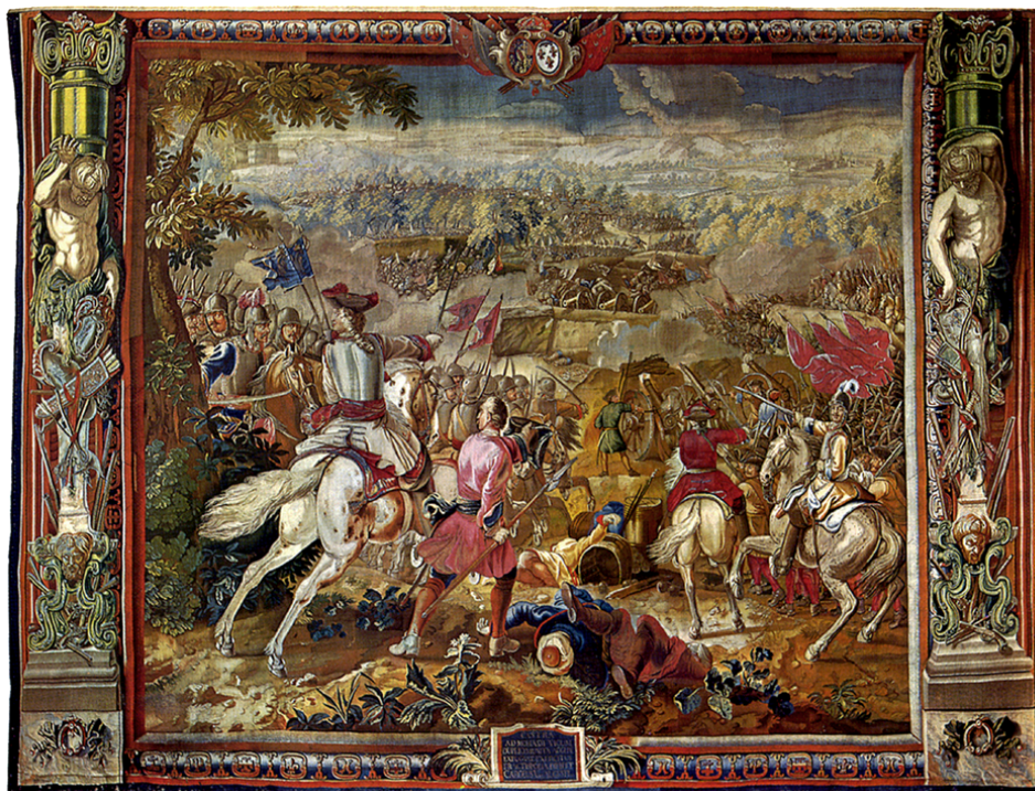
Рис. 1. Шпалера «Битва при Мохаче 13 августа 1687 г.». Из серии «Победы герцога Карла Лотарингского». Венский музей истории искусств. 440 × 595 см. Инв. IX/17

И. В. Бородин. Шпалера «Завоевание Офена герцогом Карлом Лотарингским» из Королевского дворца Будапештской крепости: к истории создания, бытования и реставрации