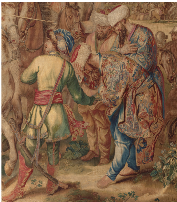
Рис. 6. Шпалера «Завоевание Офена герцогом Карлом Лотарингским». Фрагмент

И. В. Бородин. Шпалера «Завоевание Офена герцогом Карлом Лотарингским» из Королевского дворца Будапештской крепости: к истории создания, бытования и реставрации