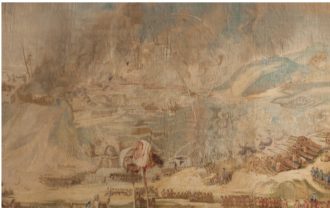
Рис. 7. Шпалера «Завоевание Офена герцогом Карлом Лотарингским». Фрагмент

И. В. Бородин. Шпалера «Завоевание Офена герцогом Карлом Лотарингским» из Королевского дворца Будапештской крепости: к истории создания, бытования и реставрации