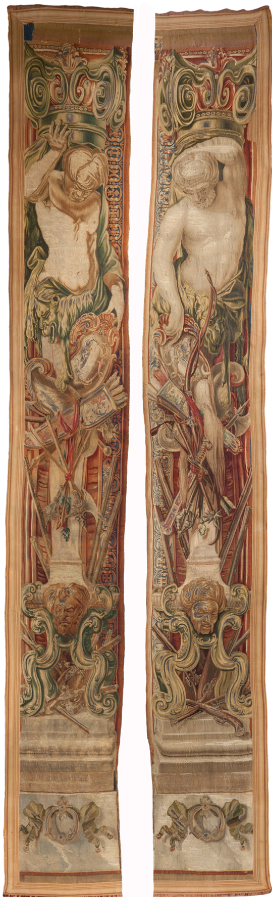
Рис. 9. Шпалера «Завоевание Офена герцогом Карлом Лотарингским». Фрагмент

И. В. Бородин. Шпалера «Завоевание Офена герцогом Карлом Лотарингским» из Королевского дворца Будапештской крепости: к истории создания, бытования и реставрации