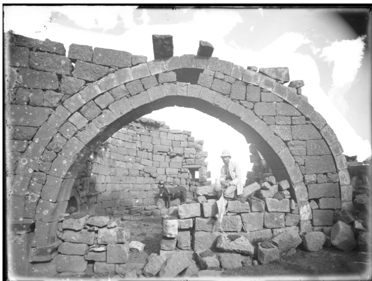
Рис. 9. И. Ф. Барщевский. 1891 г. Я. И. Смирнов под аркой христианской базилики в Шакке. № ГМИР НВ-ВР-1069/162 (П-1337)