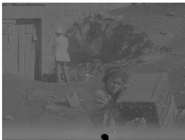
Рис. 16. И. Ф. Барщевский. 1891 г. Участник экспедиции (Я. И. Смирнов?) перед порталом древней базилики в Босре и девочка, держащая ящик. № ГМИР НВ-ВР-1069/171-фрагмент (П-1409)

Fig. 15. I. F. Barshchevsky. 1891. Portal of the ancient basilica in Bosra. No. GMIR NV-VR-1069/171 (P-1409)