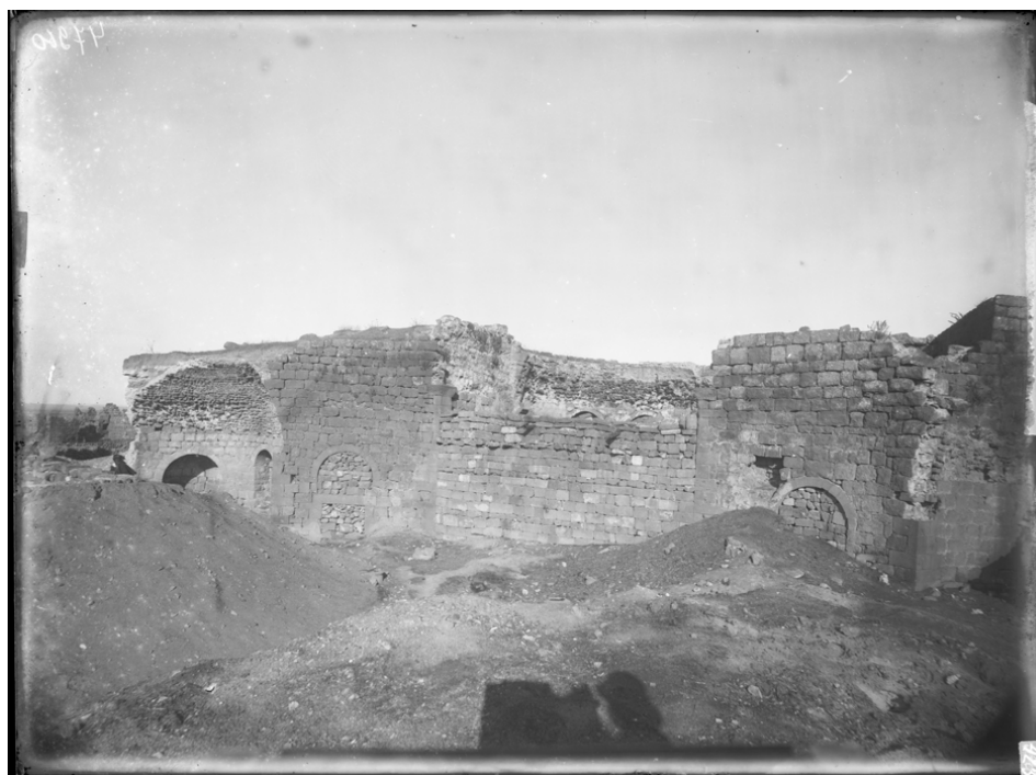
Рис. 18. И. Ф. Барщевский. 1891 г. Силуэт головы фотографа и его аппарата перед церковью свв. Сергия и Вакха в Босре. № ГМИР НВ-ВР-1069/173 (П-1413)