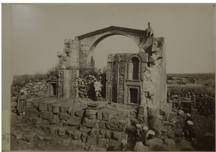
Рис. 14. И. Ф. Барщевский. 1891 г. Я. И. Смирнов перед древним храмом в селении Атиль. Инв. № ГМИР П-1390