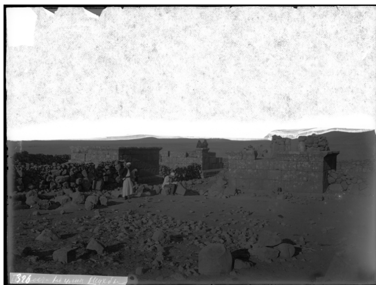
Рис. 5. И. Ф. Барщевский. 1891 г. Я. И. Смирнов на перекрестке главных улиц Шухбы. № ГМИР НВ-ВР-1069/146 (П-1306)