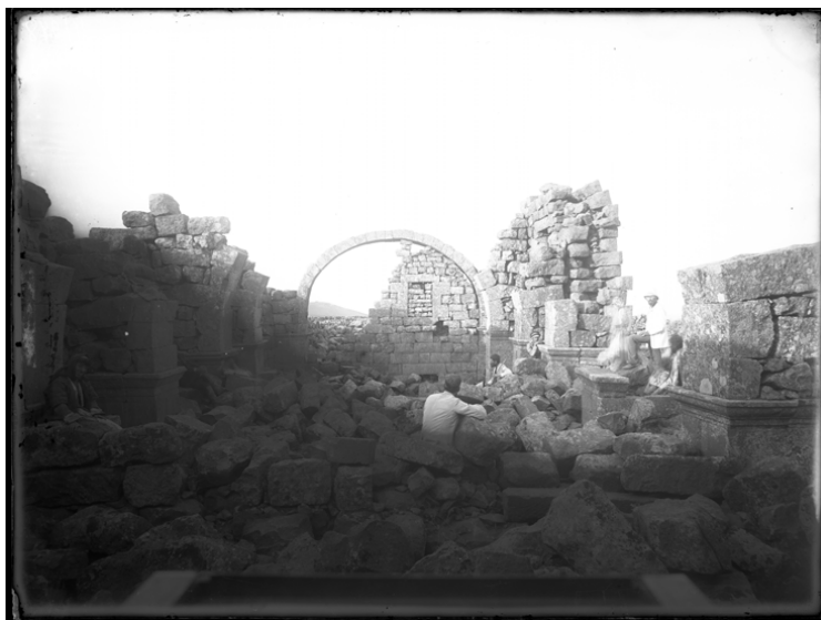
Рис. 10. И. Ф. Барщевский. 1891 г. Развалины древнего монастыря в Шакке. № ГМИР НВ-ВР-1069/161 (П-1339)